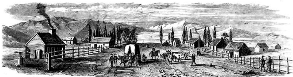
Salt Lake City 1850. Här beslutade ett kyrkomöte 6 oktober 1849 att sända missionärer till Danmark, Norge och Sverige.