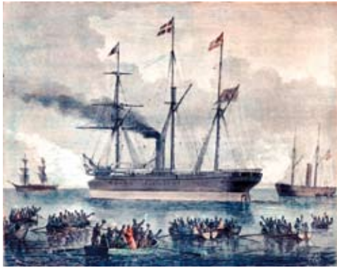
SS »Ottawa«s avgång som första ångfartyg med endast 97 danska och 15 skånska utvandrare från Köpenhamn 15 augusti 1866 firas av tusentals köpenhamnare. »Illustreret Tidende«, Köpenhamn, årgång 7, nr 361.

folk och tidningarna tvingade därför regeringarna i Danmark och Sverige-Norge till att skärpa skyddslagstiftningen för utvandrare. En lagkommission tillsattes, man gjorde studiebesök i Hamburg och antog i Danmark en lag i maj 1868 och i Sverige i april 1869. Härefter skulle det föras skepps- och passagerarlistor i Norden och alla skepp, som avgick direkt från en skandinavisk hamn till en hamn i främmande världsdal, kontrolleras. I praxis gällde det bara Köpenhamn. Nu skulle man ju kunnat tro att den katastrofala »premiären» skulle ha verkat avskräckande, men i verkligheten kom en sjättedel av den svenska utomeuropeiska utvandringen, både till USA och övriga världen åren 1868–1873, att försiggå med ångfartyg direkt från Köpenhamn eller indirekt via Köpenhamn–Hamburg eller via Köpenhamn–Hamburg–Liverpool.