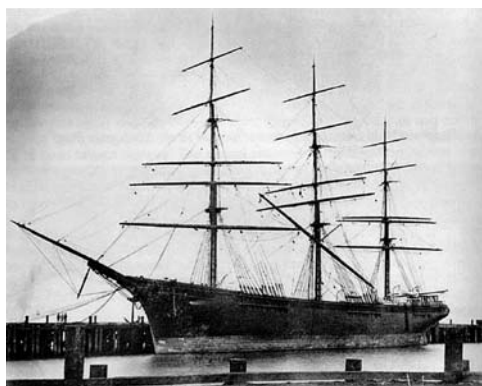
»James Nesmith», Thomastown, Maine 1850. Det var med detta skepp som 51 skånska mormoner reste från Liverpool till New Orleans i januari–februari 1855. Daguerreotypi 1850, Library of Congress.